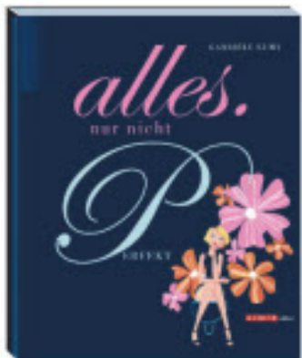
Kuhn liest aus ihrem Neuling