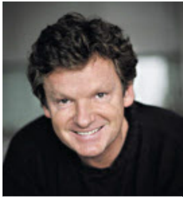
Barylli bringt Roman „Echtzeit“ mit