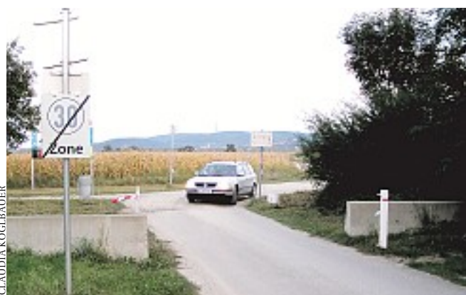
Grenzstraße von Schattendorf nach Ágfalva wird bald ausgebaut

Grenzübergänge sind nicht immer per Pkw passierbar. Schattendorf und Ágfalva bauen jetzt die Verbindungsstraße aus.