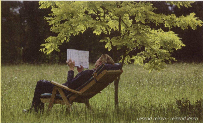
Lesend reisen – reisend lesen

Bibliotels www.bibliotels.com E-Mail: office@bibliotels.com Telefon: (0662) 84 10 79 Telefax: (0662) 84 82 73