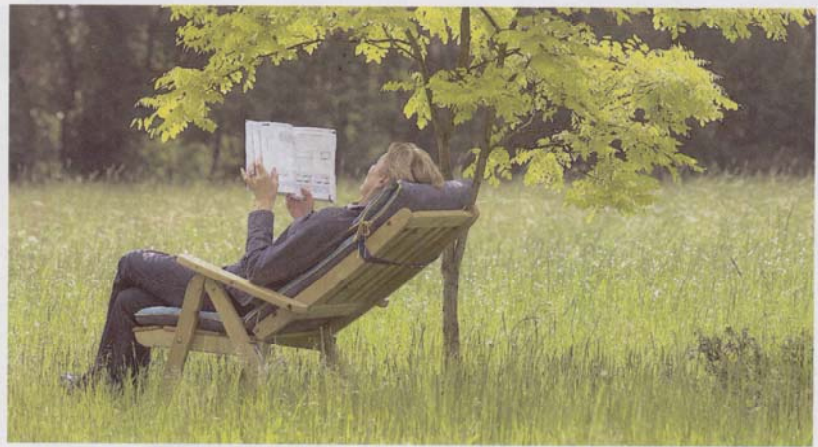
Die Bibliotels sind eine Eigenentwicklung der Innovationswerkstatt, als Kooperationspartner aus der „Welt der Bücher“ haben sich Thalia, Morawa und einige Verlage eingefunden

lienhôtel mit spezieller Kinderliteratur und Lesungen von Kinderbuchautoren ebenso geben wie das Krimi-Bibliotel“, erklärt Mettler die erlesene Strategie. Sobald die Kooperationen in Österreich abgeschlossen sind, konzentriert sich die Innovationswerkstatt auf die Anfragen aus dem Ausland , sogar in Irland zeigt man schon Interesse an dem touristischen Angebot. In den nächsten drei Jahren werden dann Bibliotels in Deutschland, der Schweiz und Italien entstehen.