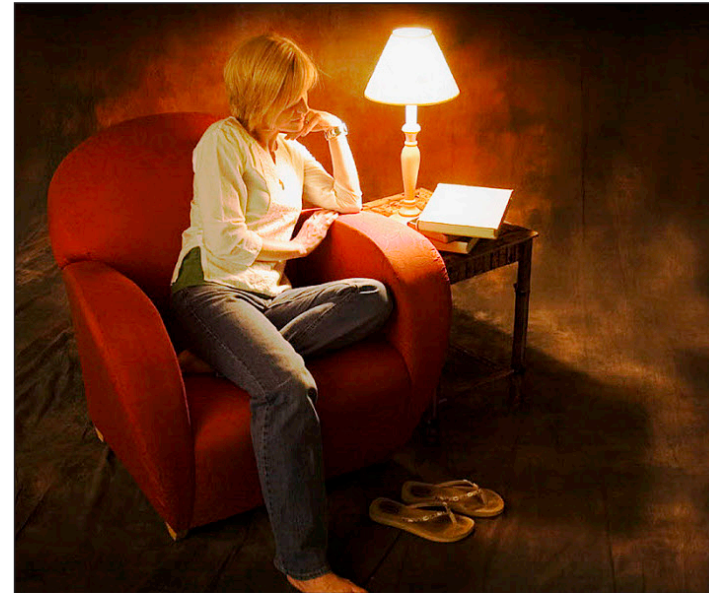
Un choix de livres plus au moins étoffé attend les hôtes.

La lecture, on le sait, peut être très absorbante. Aussi, le client se voit proposer – sans augmentation de prix – une offre de snacks servis en chambre de 9 heures à 23 heures, ainsi que la possibilité de prendre le petit-déjeuner jusqu'à 12 heures. On relèvera, par ailleurs, qu'au restaurant, la lecture à table est acceptée et que le personnel de l'éta-